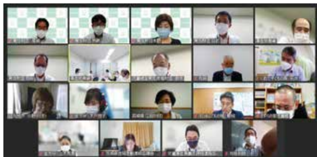
オンラインでの意見交換の様子

その後、同省の里平子育て支援課長にはオンラインにて各児童館関係団体代表と面談の時間をいただき、提出した要望に関して「国会においてこども家庭庁設置法案が成立し、来年4月1日よりこども家庭庁が内閣府に設置される。児童館はサードプレイスといわれる子どもの居場所として、今後大きく注目され見直される。放課後児童対策に関する専門委員会でもワーキングチームをつくり、児童館のあり方について再度検討することとしている。今回の要望にできる限り回答し、児童館の皆さんに活躍していただきたい。」とのコメントをいただきました。